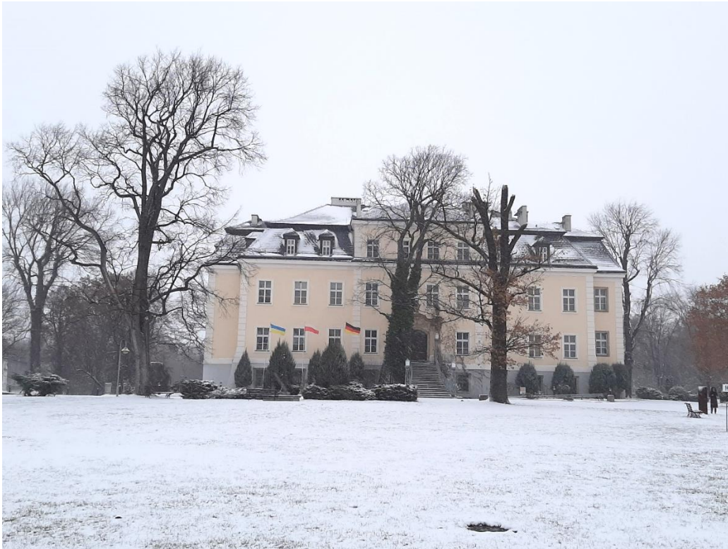
Abbildung 2: Das "Schloss"

befand sich das ehemalige Waschhaus, wohingegen dort jetzt die Kunstwerkstätten und eine Galerie sind. Das vierte Gebäude in dieser Geraden wurde als Remise genutzt. Unter einer Remise wird heute eine Art Schuppen oder Garage verstanden, in dem die Wagen, Kutschen, Geräte und Werkzeuge aufbewahrt wurden. Heute findet sich in dem Gebäude ein Kindergarten.