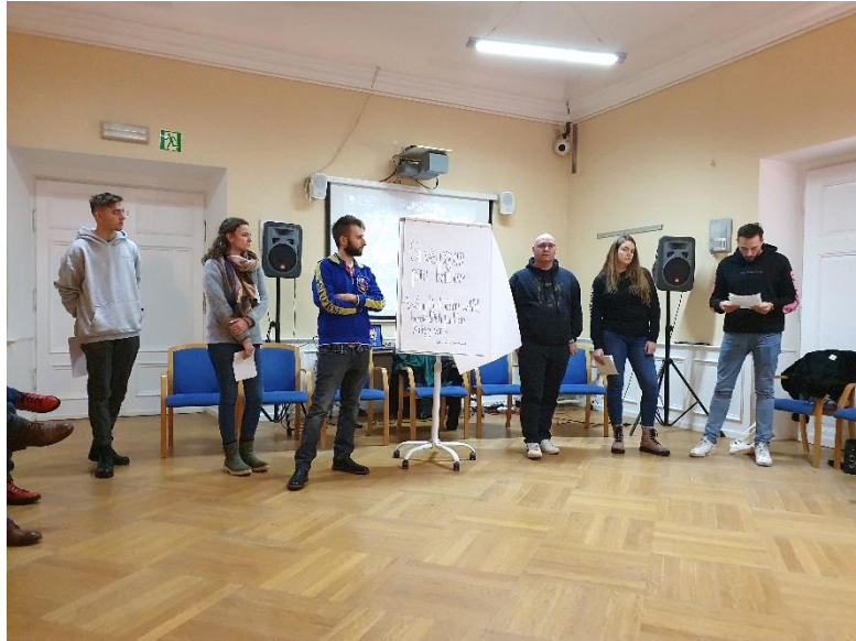
Abbildung 2: In Kreisau bei der Arbeit

den letzten Tagen vor seiner Hinrichtung schrieben. Während bei früheren Gruppen hier bisweilen Tränen flossen, zeigte sich die jetzige sehr reflektiert. Für mich ist es immer wieder spannend zu beobachten, wie unterschiedlich die Briefe am Ort der Verschwörung wirken können.