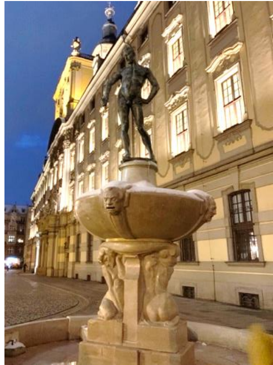
Abbildung 2: Fechterbrunnen bei Nacht

Die Universität ist, wie so häufig, an verschiedenen Standorten in der Stadt zu finden. Das Hauptgebäude der Universität liegt an der Oder in der Breslauer Altstadt. Bevor wir das Gebäude an der Südostseite betreten, begutachten wir erst einmal den „ Fontanna Szymierz “, den „Fechterbrunnen“. Ein Denkmal, das, so sagte man uns, ab und an (wie auf dem Foto) plötzlich ohne Florett zu bestaunen ist, welches dann wohl stattdessen im Zuhause eines/einer Studierenden die Wand schmückt.