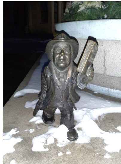
Abbildung 3: Einer, der bei der Jahrhunderthalle versteckten Zwerg

Ebenso wie bei der Exkursion 2018 war auch in diesem Jahr eine Besichtigung der Halle nicht vorgesehen. Dies ist, mit Blick auf das umfangreiche Programm der einwöchigen Exkursion weder verwunderlich noch verwerflich. Dennoch entschied sich ein Großteil der deutschen Studierenden dazu, dieses Bauwerk mit eigenen Augen gesehen haben zu wollen. Aber nicht nur das Gebäude selbst zog uns in den östlicheren Teil der Stadt. Für zwei Teilnehmerinnen war dieser individuell geplante Ausflug auch ein wichtiger Aspekt beim Aufspüren entscheidender Zwerge.