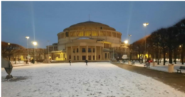
Abbildung 4: Jahrhunderthalle im Schnee

Mit der Unterstützung polnischer Studierenden nahmen wir die Straßenbahn zur Haltestelle „Hala Stulecia“. Meine persönliche Motivation, die kostbare, zur freien Verfügung stehende Zeit hierfür zu verwenden, lag darin, dass (Sport)Hallen auf mich eine