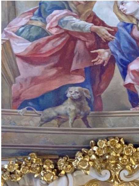
Abbildung 4 und 5: Die Deckengemälde wurden erst 2013/2014 von dem Maler Christoph Wetzel wieder hergestellt.

Der Festsaal der Universität, das Oratorium Marianum, begeistert ebenfalls mit bunten Reliefs, die, im Gegensatz zur Aula, nach dem zweiten Weltkrieg aufgrund eines Bombenangriffs beschädigt wurden und restauriert werden mussten. 99