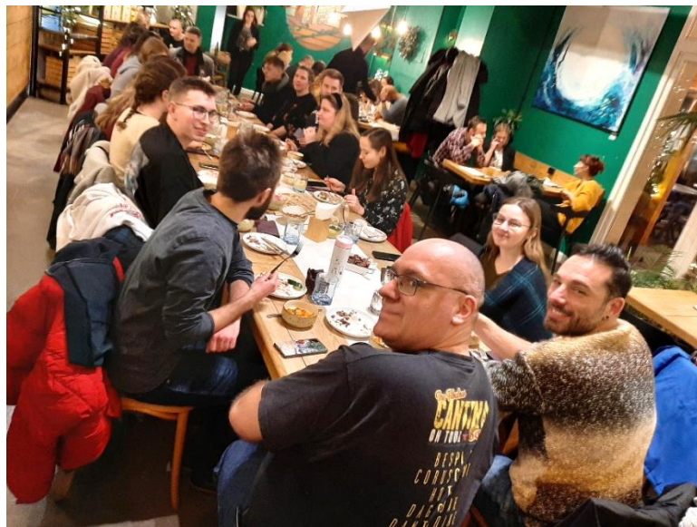
Abbildung 3: Wir wurden großzügig bewirtet