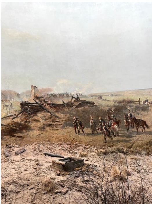
Abbildung 2: Gefangene hohe russische Offiziere

Schlacht ist jedoch nicht der Sieg der Polen, vielmehr geht es um den Zusammenschluss der polnischen Bevölkerung, von Adel und Bauern, um die Teilung Polens zu verhindern. Auch war eine jüdische Legion an dem bewaffneten Aufstand beteiligt. Dabei wurden die regulären polnischen Truppen unter der Führung des Generals Tadeusz Kościuszko (1746-1817) von Bauern unterstützt, indem diese Seite an Seite kämpften. Während die Soldaten mit schweren Geschützen ausgestattet waren, kämpften die Bauern mit Sensen bewaffnet gegen die russischen Streitkräfte. Schätzungen zufolge starben während der Schlacht circa 1.000 russische Soldaten und 500 Polen. Nach dem ersten militärischen Sieg der Polen übertrug sich der Aufstand auf das ganze Land. Jedoch griffen im Juni 1794 preußische Verbände in die Kämpfe ein, sodass die militärische Übermacht der Teilungsmächte gesichert wurde. In der Folge geriet Tadeusz Kościuszko in russische Gefangenschaft, und der Widerstand wurde gebrochen. 115 Trotz des letztlichen Scheiterns wird die Schlacht aus polnischer Sicht als wichtiges historisches Ereignis betrachtet, das den geleisteten Widerstand und Zusammenhalt des Landes darstellt, sodass die Schlacht von Raclawice noch heute von großer gesellschaftlicher Bedeutung ist. 116