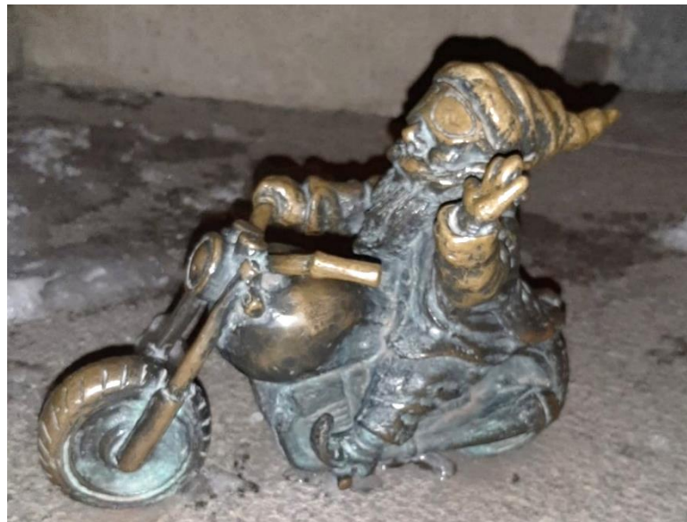
Abbildung 3: Motorradfahrender-Zwerg

„Nach dem Jahr 2000 gab es eine große Diskussion, wie die Stadt sich vermarkten könnte. Man suchte etwas, das unverwechselbar war und identitätsstiftend, und weil es die [...] Zwerge nur in Breslau