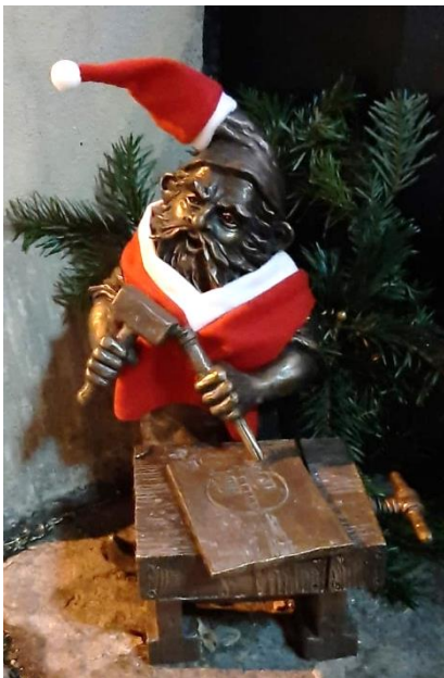
Abbildung 2: Weihnachtlicher Zwerg

Im Jahr 1948 ergriffen die Kommunisten die Macht in Polen, und eine Umformung der Gesellschaft im Sinne einer neuen Ideologie der Gesellschaft, des Staates und der Wirtschaft fand statt, dies wurde auch den Bewohner*innen Wroclaws bewusst. Die polnischen Behörden behandelten die Stadt widersprüchlich: Auf der einen Seite prahlten sie mit dem Erfolg des Wiederaufbaus, mit der „Rückeroberung“ und der erfolgreichen Integration der „wiedergewonnenen“ Gebiete in den polnischen Staat. Andererseits nutzen sie die technischen und materiellen Ressourcen Wroclaws als Reservoir für Zentralpolen aus. Die Stadt selbst stand nur sehr selten auf der Liste der Investitionsprojekte des Landes, und daher sind einige dieser Vernachlässigungen der Behörden auch heute noch zu bemerken, wie beispielsweise im Bereich der Verkehrsinfrastruktur. 120