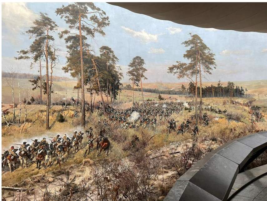
Abbildung 1: Bildausschnitt des Panoramagemäldes. Polnische Truppen schießen auf (links außerhalb des Ausschnittes reitende) Kosaken

Obwohl das Monumentalgemälde eine Kriegsschlacht darstellt, ist die Kriegshandlung vom Publikum nicht unbedingt als negatives Ereignis wahrzunehmen. So wurden für das Gemälde viele helle Pastelltöne verwendet, und die Darstellung des Himmels ist klar und hell gehalten. Dies hat zur Folge, dass die