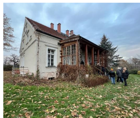
Abbildung 5: Das Berghaus. Wohnhaus der Moltkes und Versammlungsort der Widerstandsgruppe „Kreisauer Kreis“

Bis 1989 verfiel das Herrenhaus aufgrund der Wettereinflüsse zusehends. Die Decken, sowie die Treppen des mehrstöckigen Anwesens brachen teilweise ein. Erst durch die 1991 gegründete „Stiftung für deutsch-polnische Zusammenarbeit“ 60 wurde mit der Rückendeckung beider Nationen die Renovierung möglich. Die Stiftung und Bürgerinitiative 1989 beschloss, auf dem Anwesen eine Begegnungsstätte zu gründen. Mittlerweile hat sie sich zur größten polnisch-deutschen Jugendbegegnungsstätte in