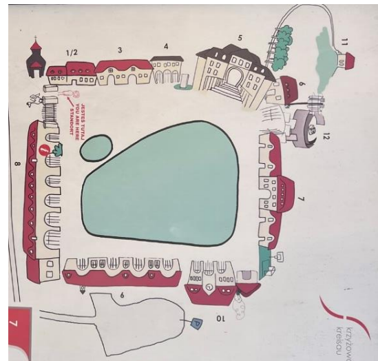
Abbildung 1: Lageplan des Guts Kreisau auf einer Infotafel

Noch bevor man das Gut betritt, befindet sich außerhalb der Tormauern eine von Helmuth von Moltke selbst entworfene Kapelle. Zwei Jahre nach Erwerb des Guts starb seine Gattin an Weihnachten 1868. Nach der Fertigstellung im Jahr 1869 bestattete er seine geliebte Ehefrau in der Kapelle und wurde selbst 23 Jahre nach ihrem Tod dort neben ihr begraben. 56