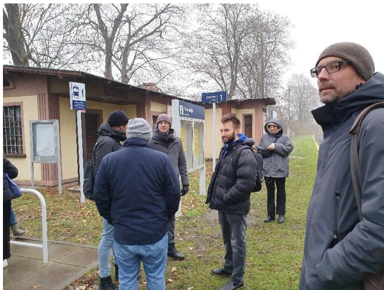
Abbildung 4: Am „Kaiserbahnhof“ des ehem. Guts Kreisau (Gleis 1 – das einzige)

Wir freuen uns auf den Gegenbesuch der polnischen Gruppe, der in der Woche nach Ostern stattfinden soll!