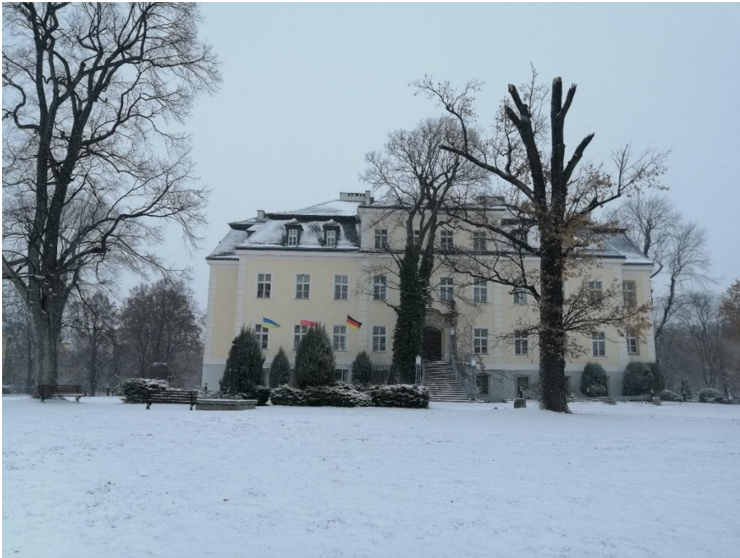
Abbildung 4: Herrenhaus auf dem Gut Kreisau

kleines Gut darstellte, und beinhaltete ein Herrenhaus („Schloss“) und einen Wirtschaftshof. 18