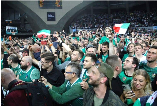
Abbildung 5: Aufnahme nach dem Spiel

Besonders beeindruckend finde ich, dass die Halle noch heute, ungefähr 110 Jahre nach der Eröffnung, für Veranstaltungen wie Messen oder Sportereignisse genutzt wird. Im Mai 2022 fand zum Beispiel das Finale zur polnischen Basketballmeisterschaft, vor ca. 6.000 Zuschauern, in der Jahrhunderthalle statt. 107 Ganz zur Freude unserer polnischen Gastgeber gewann Śląsk Wrocław, nach einer 20-jährigen Durststrecke, die insgesamt achtzehnte Meisterschaft. 108