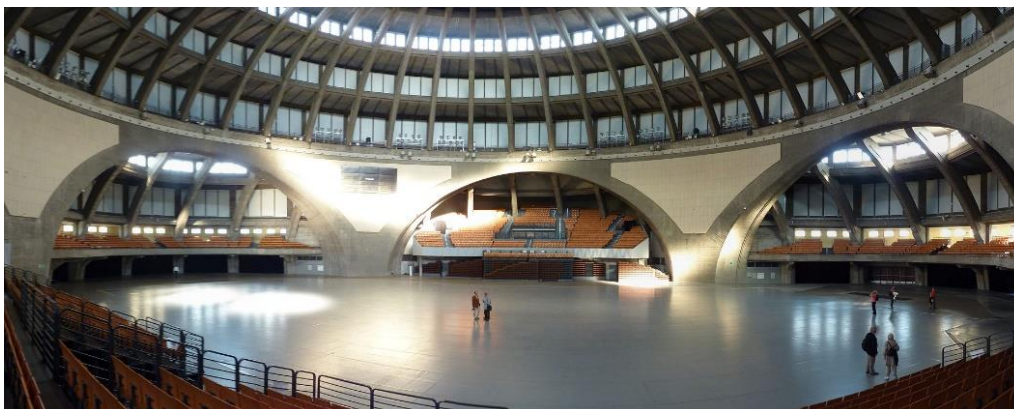
Abbildung 2: Blick in den Innenraum der Halle