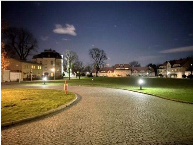
Abbildung 4: Parkanlage des Gut Kreisau bei Nacht vom Kuhstall aus

Der Park, der sich noch heute als Zentrum des Vierseitenhofes rühmt, wurde von Helmuth von Moltke selbst angelegt. In den Sommermonaten verbrachte er seine meiste Zeit in diesem Park. Er bestand darauf, jeden Samen und jeden Setzling eigens einzupflanzen und jeden Baum oder Strauch selbst zu stützen. Diese Arbeit, die nur seinem Schönheitsempfinden ohne wirtschaftlichen Nutzen galt, gestattete er sich, sein ganzes Leben lang gesehen, als einzigen Luxus. 58