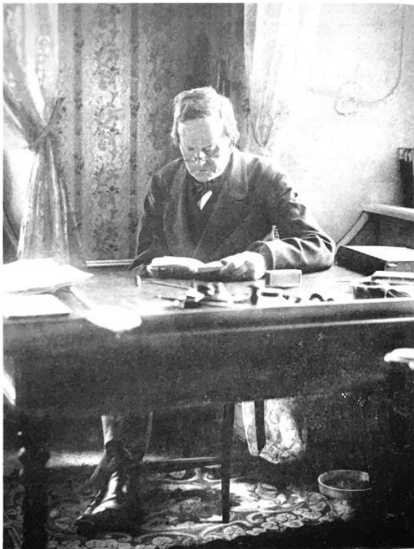
Abbildung 1: Moltke am Schreibtisch in Kreisau.

In der Familie von Moltke gab es mehr als einen Helmuth, von denen zwei die Geschichte besonders prägten: der Jüngere, Helmuth James Graf von Moltke, der als Gründer der antinazistischen Widerstandsbewegung „Kreisauer Kreis“ in Erinnerung geblieben ist, und sein Urgroßonkel, Helmuth Karl Bernhard von Moltke, der vor allem als prominenter Generalfeldmarschall und Initiator der Auftragstaktik bekannt wurde. Letzterer war eine inspirierende und vielseitige Persönlichkeit, die in verschiedenen Bereichen einen Nachlass hinterlassen hat, der in diesem Beitrag in Erinnerung gerufen werden soll.