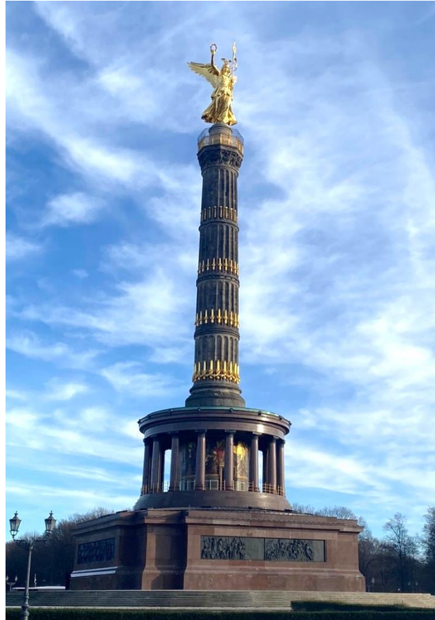
Abbildung 5: Siegessäule in Berlin

Durch die siegreiche Gestaltung der deutschen Einigungskriege für Preußen kann Helmuth von Moltke neben Otto von Bismarck zu einem der Gründungsväter des deutschen Nationalstaates gezählt werden, woran unter anderem die Siegessäule in Berlin und das nur einen Steinwurf davon entfernte Moltke-Denkmal erinnern. Von Moltkes Interesse an der Politik und Geschichte anderer Länder zum einen und die Entwicklung der Auftragstaktik zum anderen zeigen retrospektiv betrachtet den Menschen Moltke als Visionär, für welchen trotz seiner militärischen Erziehung nicht zwingend der Krieg im Vordergrund stand, sondern eben insbesondere die Menschen mit ihrer individuellen Entscheidungsfähigkeit