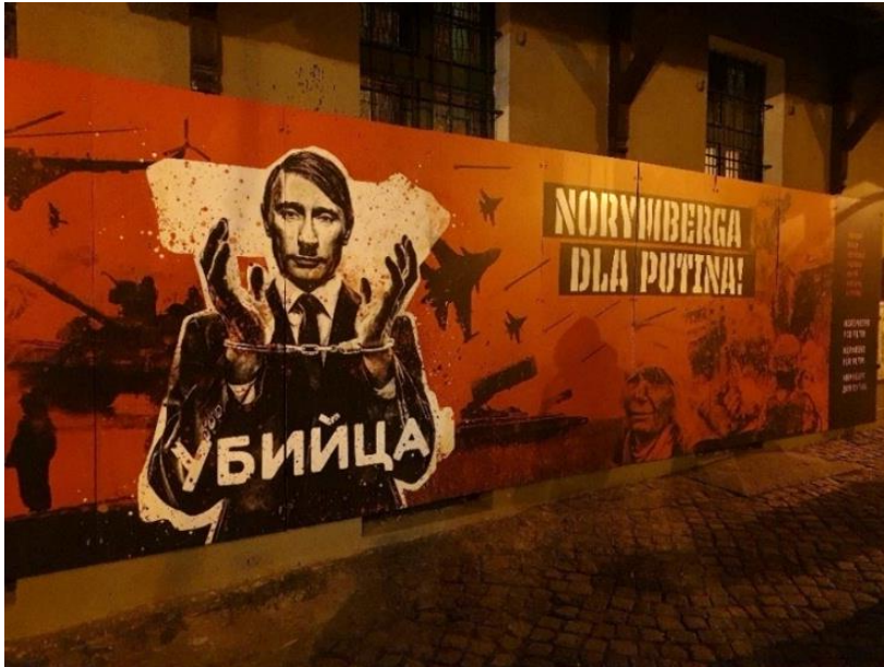
Abbildung 2: Auf Polnisch steht dort: "Nürnberg für Putin"

Klimaaktivismus ist womöglich eines der breitesten Gebiete, in dem moderner Widerstand geleistet wird. Der Krieg in der Ukraine, welcher durch Russland begonnen wurde, hat in Polen allerdings vermutlich ein dringlicheres Anliegen. Durch Gespräche mit den Pol*innen hat sich herausgezeichnet, dass in Polen eine tiefe Anerkennung gegenüber den Ukrainer*innen besteht, denn – ich paraphrasiere: „Wenn die Ukrainer den Krieg verlieren, wären wir als nächstes dran.“