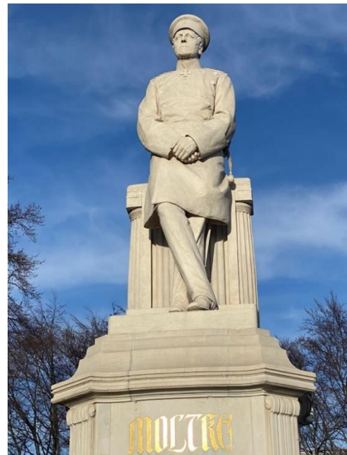
Abbildung 2: Moltkedenkmal Berlin

Es war von Moltke, der die deutschen Einigungskriege zu Gunsten Preußens entschied. Der Sieg gegen Dänemark 1864 brachte ihm einen Namen als fähiger Stratege ein. Spätestens jedoch nach der Schlacht bei Königgrätz 1866 im Preußisch-Österreichischen Krieg, welche durch von Moltkes moderne Methoden, worauf in diesem Beitrag noch eingegangen wird, gewonnen wurde, war sein Name in aller Munde. 1870 erhob ihn der König in den Grafenstand. Im selben Jahr begann der Krieg gegen Frankreich, die stärkste Konkurrenz auf dem Kontinent. Auch dieser Krieg wurde nicht zuletzt durch das Zutun von Moltkes