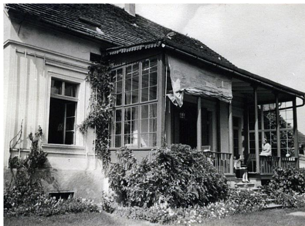
Abbildung 1: Im Berghaus fanden die drei Tagungen statt

Während den Jahren 1942 und 1943 trafen sich die Kreisauer drei Mal im Berghaus des Hofguts Kreisau. Die Ergebnisse der Tagungen wurden in mehreren Grundsatz-erklärungen schriftlich festgehalten. Auf den 9. August 1943 datiert wurden die „Grundsätze für die Neuordnung“, in denen die großen Linien des Kreisauer Programms dargestellt sind. Erstens soll die Grundlage dieses neuen Staates der Individualismus sein, der sich gegen den nationalsozialistischen Kollektivismus und die Vermassung der urbanen Industriegesellschaft richtete. Im Zentrum aller Erwägungen stand der einzelne Mensch, dessen Freiheit der neue Staat im größtmöglichen Umfang gewährleisten sollte. 80 Zweitens soll dieser Staat von „unten“ und auf Basis von überschaubaren Selbstverwaltungseinheiten aufgebaut werden. Diese Vorstellung stellte eine radikale Abkehr vom traditionellen Obrigkeitsstaat dar, der den deutschen Staat seit seiner Gründung geprägt hatte. 81