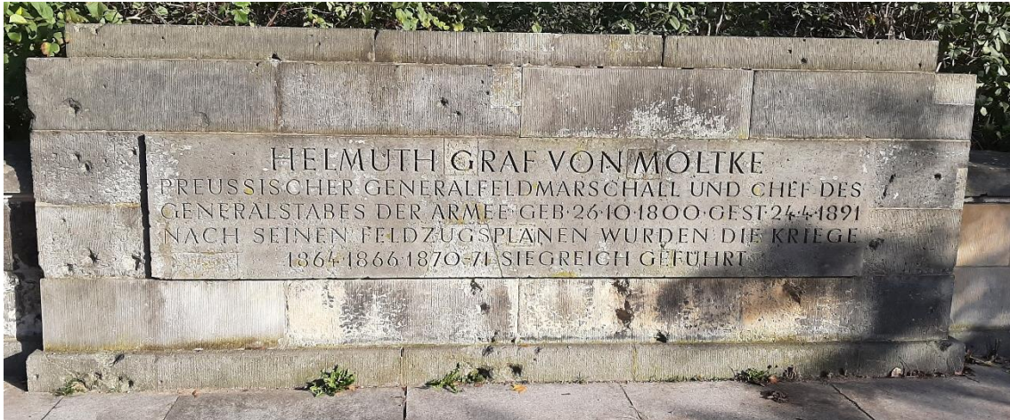
Abbildung 3: Inschrift in der Steinmauer hinter dem Moltkedenkmal in Berlin

Im 21. Jahrhundert erinnern sowohl die Siegessäule in Berlin wie auch ein ca. 150 m davon entferntes Denkmal, welches den an eine Säule angelehnten von Moltke zeigt, an ebenjene Siege und damit verbunden von Moltkes Gründungsbeitrag am deutschen Nationalstaat.