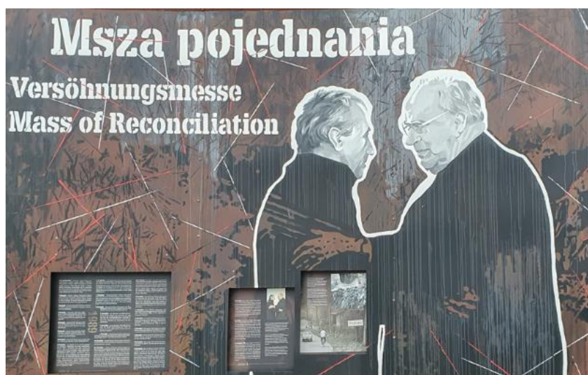
Abbildung 1: Ein Teil der Ausstellung "Mut und Versöhnung"

Ein weiteres wichtiges Ereignis, das hier auf Grund des Charakters und der Tragweite des Kreisauer Kreises stattfand, ist die deutsch-polnische Versöhnungsmesse 1989 drei Tage nach dem Fall der Berliner Mauer. Hier entstand ein eindrucksvolles Bild,