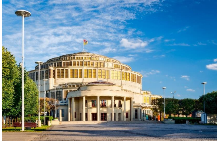
Abbildung 1: Die Jahrhunderthalle (Aufnahme aus dem Jahr 2014)

Beim Betrachten der Reader der Wrocław-Exkursionen aus den beiden Jahren 2018 und 2019 stellt man fest, dass die Jahrhunderthalle bereits zweimal das Interesse der Studierenden weckte.