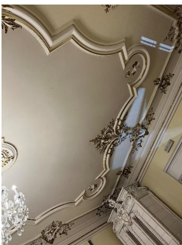
Abbildung 3: Prunkvoller Deckenstück im Ballsaal des Herrenhauses

Das größte Gebäude mit dem schwarzen Dach ist das „Schloss“ genannte Herrenhaus. Das Herrenhaus ist auf dem Dach absichtlich anders gedeckt worden und steht ohne Anbindung zu übrigen Gebäuden, um ihm eine besonders starke Wirkung zu geben. Heute werden die Räumlichkeiten nur noch für Ausstellungen und als Seminarräume genutzt. Leider war eine Instandhaltung nach dem Zweiten Weltkrieg für Kreisau und die polnisch-sozialistische Regierung aufgrund der politischen Hintergründe nicht erwünscht. Wegen des starken Zerfalls und den weiterhin hohen Kosten, das Schloss zu erhalten, ist nur noch