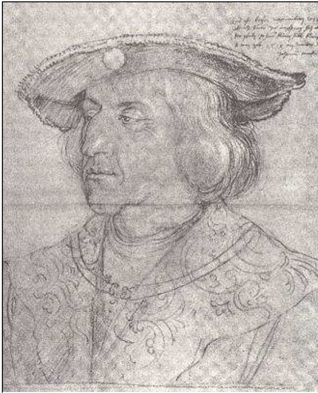
Abb. 1: Maximilian I., Albrecht Dürer, 1518

Seine 26jährige Regierungszeit bezeichnete den Anfang einer für sein Geschlecht glänzenden Epoche. Sind die Habsburger im ausgehenden 15. und beginnenden 16. Jahrhundert doch zur führenden europäischen Kontinentalmacht aufgestiegen. Das hatte vor allem mit einer dynastisch ausgerichteten Politik zu tun, die zu einer starken Vermehrung der habsburgischen Erbländer beitrug. Zu dieser Zeit entstand denn auch das, was man später stolz als das »Haus Österreich« bzw. als das »Haus Habsburg« bezeichnet hat. Wer einen Eindruck vom exklusiven Selbstverständnis dieses Geschlechtes gewinnen will, der reise nach Wien und steige in die Kaisergruft der Kapuzinerkirche, wo die Habsburger seit dem 17. Jahrhundert ihre Familiengrablege eingerichtet haben.