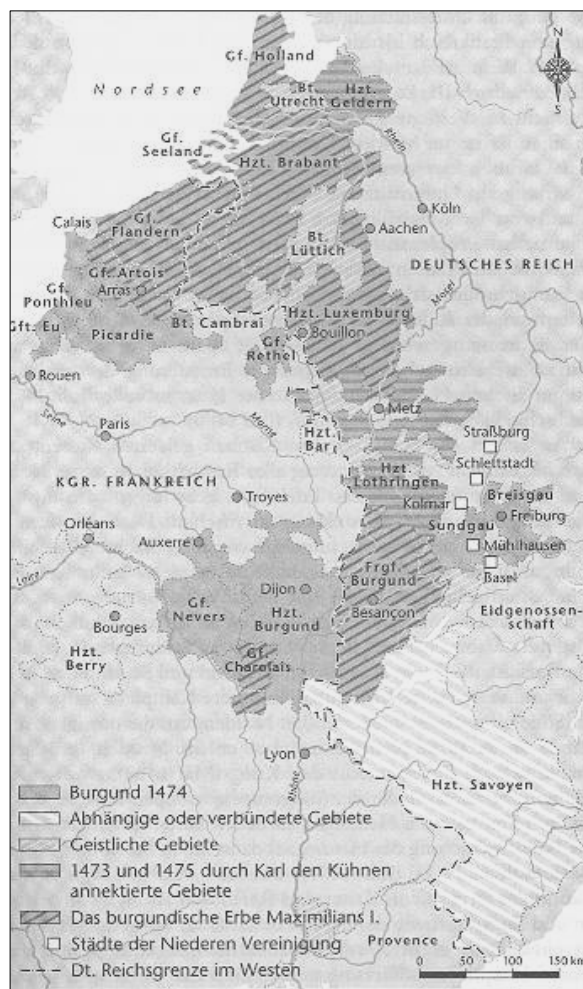
Abb. 2: Der burgundische Machtbereich und Maximilians burgundisches Erbe

Um die Institution des Reichstags zu verstehen, muss man etwas über die politische Struktur des spätmittelalterlichen Reiches wissen. Sie ist nicht in jeder Hinsicht mit unserer heutigen modernen Politik zu vergleichen, zumal es noch keine Hauptstadt gab, in der ein Parlament hätte tagen und sich zu seinen Beschlüssen regelmäßig hätte versammeln können. Maximilian war in diesem Sinne noch ein mittelalterlicher »Reisekönig«. Er zog in seinem Reich umher und herrschte, wie man gesagt hat, »ambulante«. Der Verwaltungsmittelpunkt des Reiches war dort, wo sich der König gerade aufhielt.