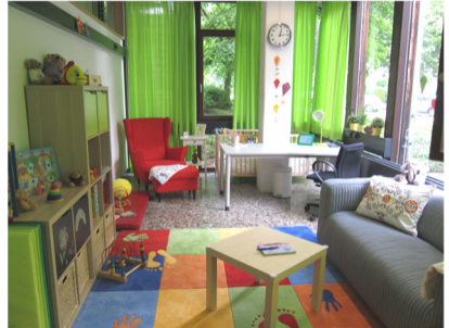
Eltern-Kind-Zimmer der PH im Mensa-Gebäude

Sie sind schon Eltern oder erwarten ein Kind? Sie interessieren sich dafür, wie Schwangerschaft und Elternschaft mit dem Studium vereinbart werden können und welche Unterstützungsmöglichkeiten die Hochschule bietet? Dann sind Sie herzlich willkommen zu einem Beratungsgespräch!